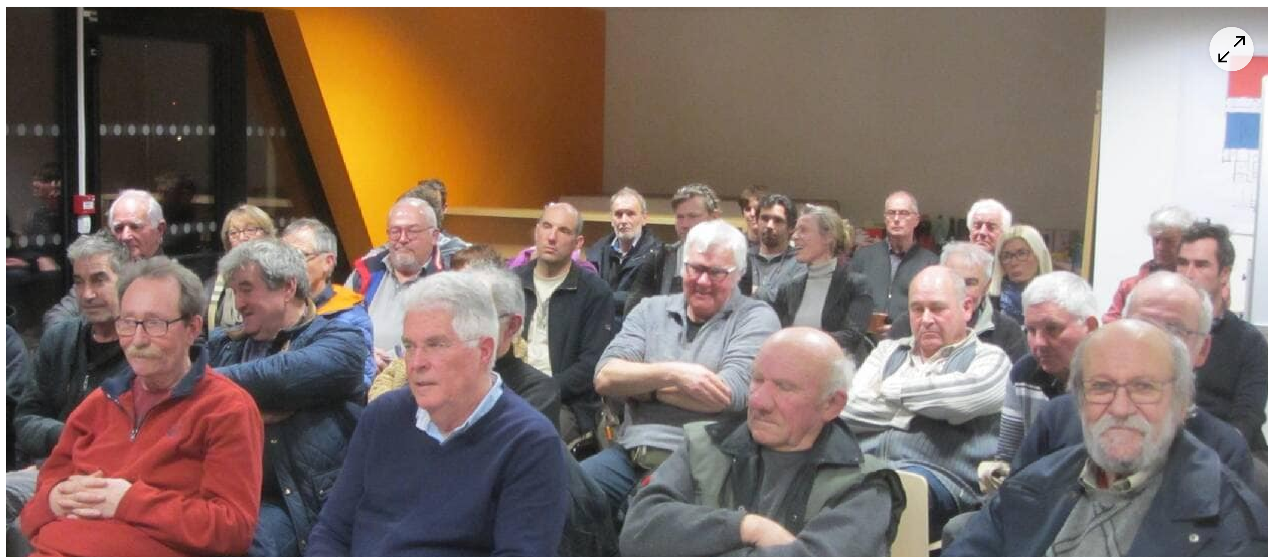
L'assemblée générale de l'Amicale des plaisanciers du Rosmeur s'est tenue à la Plaine des sports, vendredi. | OUEST-FRANCE

Faute de local, l'assemblée générale de l'Amicale des plaisanciers du Rosmeur, a échoué à la Plaine des sports, vendredi.